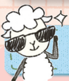
그림 속으로 고고씩~

“너희 ○○○에는 너희가 모르는 분이 서 계신다.” (요한 1,26 참조)